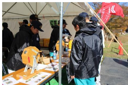
受付★ガラポン抽選会も実施