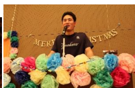
▲ 寮祭(11月) お楽しみ会&火文字

3月 1日(日) 卒業式 4日(水) 高校入試一次試験(～5) 11日(水) みやぎ鎮魂の日 16日(月) 一次合格発表 20日(金) 春分の日 24日(火) 修業式 25日(水) 学年末休業(～31) 27日(金) 離任式