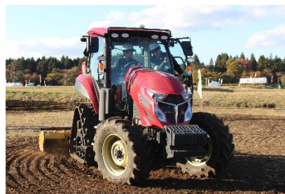
最新の農業機械に試乗！