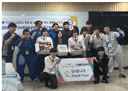
京畿自動車科学高等学校見学

令和7年11月12日(水)～15日(土)に3泊4日の日程でマイスター・ハイスクール事業の「韓国訪問」が行われました。農業機械科の生徒5名と引率教員3名が京畿自動車科学高等学校と歴史的建造物である景福宮を訪問しました。学校訪問では情報交換や実習体験を行い、韓国の自動車教育を知ることができました。この訪問を通して生徒たちは最新の自動車実習設備や、韓国の歴史に触れることができました。