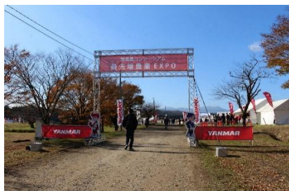
農業EXPO入口★展示会場へ

11月14日(金)・15日(土)の2日間、「最先端農業EXPO」が開催されました。本校は文部科学省の「マイスター・ハイスクール事業」指定校で、最終年度を迎え、宮城ヤンマー商会の全面協力の下、EXPOを実施しました。東京ドーム17個分の広大な敷地に最新農業機械が並んだ光景は圧巻で、大勢の来場者で賑わいました。また、1~3年の農業機械科の生徒が運営に参加、テント設営や各ブースの補助等ヤンマー社員をサポートし貴重な体験となりました。