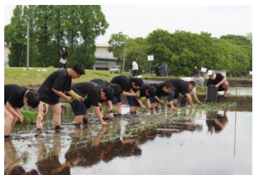
第3位となった農業機械科2年生