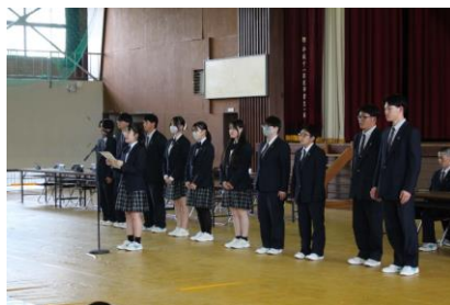
令和7年度 生徒会役員