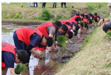
第1位となった農業科2年生

5月23日(金)に全校田植えを実施しました。当日は天気にも恵まれ、爽やかな舟形おろしの風を感じながら田植えを行いました。1年生は初めての参加でしたが、農場の先生方の指導を受け、丁寧に田植えを行いました。2・3年生は昨年度の経験も踏まえて事前にしっかり準備を行い、クラスごとに準備が整うと、かけ声で気持ちを合わせて田植えを行いました。また、気合いを入れるクラス、お揃いのTシャツを着て盛り上がるクラスなど、それぞれのクラスが自分たちの持ち味を発揮しながら田植えを行いました。速さだけではなく、「きれいさ」「クラスのまとまり」「連携」の3点で審査が行われました。今年度は農業科2年生が第1位となりました。第2位は生活技術科3年、第3位は農業機械科2年生でした。特別賞は生活技術科1年が受賞しました。さすが農業科、2年連続で1位獲得でした。