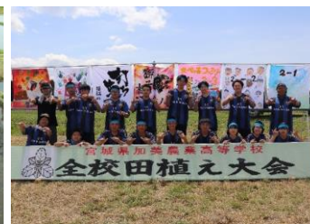
最高の田植えでした！