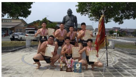
県総体 相撲部 団体優勝！

5月29日(木)に行われた県総体壮行式では、各部活動の地区総体結果報告とともに、県総体へ出場する部活動の生徒より意気込みや出場選手の紹介が行われました。県総体へはバレーボール部・柔道部・相撲部・剣道部・テニス部・陸上競技部が出場しました。