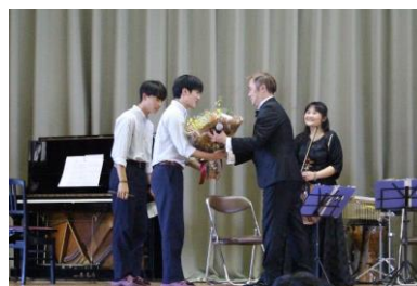
お礼の言葉・花束贈呈