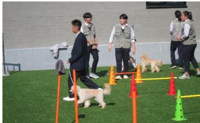
生物資源学科ペット専攻の体験