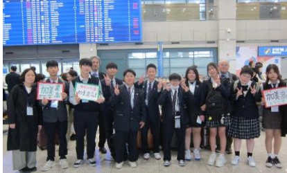
韓国仁川(インチョン)空港での歓迎の様子

本校では、平成3年の韓国の水原(スウォン)農生命科学高校との姉妹校締結後、相互訪問を行っています。両校間での学術的、文化的交流を通して日韓の友好親善を育んできました。今年は5年ぶりの訪問ということで、10月30日(水)から11月2日(土)の4日間の日程で、本校の生徒7名、校長以下教員2名が水原農生命科学高校を訪問しました。