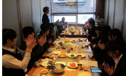
1日目の歓迎夕食会