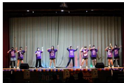
校内ステージ発表 ( 農業科3年・農業機械科3年・生活技術科3年 )