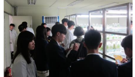
バイオ棟施設見学