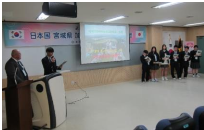
加美農紹介プレゼンテーション