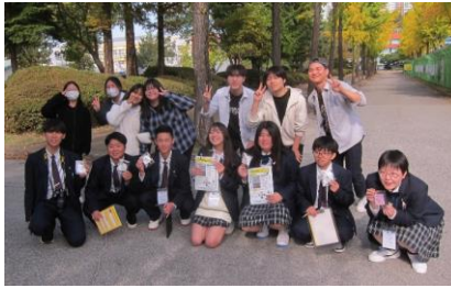
水原(スウォン)農生命科学高校の生徒達と