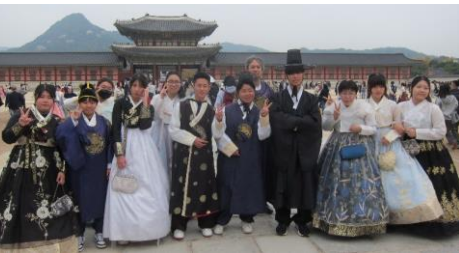
景福宮で民族衣装を身にまとい