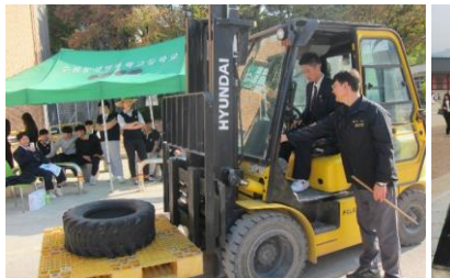
フォークリフトの運転実習