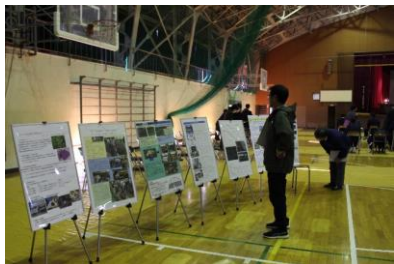
各発表のポスター展示

11月13日(水)、今年度の学習成果発表会を本校体育館で行いました。12月に行われる農業クラブ宮城県連盟のプロジェクト発表会の校内予選も兼ねています。各専攻13チームが今までの学習の成果を発表し、「見守り Beans プロジェクト」と題して発表した農業科・生活技術科果樹専攻班が最優秀賞となりました。また、色麻学園の中学2年生の生徒も来校し、加美農の学習内容と生徒の頑張りを知ってもらう一日になりました。