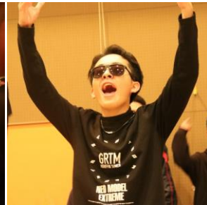
♪余興で盛り上がりました!