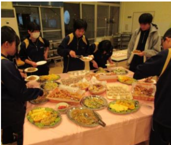
バイキング♡! みんなで乾杯 (*^o^*)

11月7日(木)に寮祭を開催しました。棟ごとの余興や、寮務部の先生方の余興、火文字で大変盛り上がりを見せた寮行事でした。夕食のバイキングも豪華で楽しい思い出となりました。