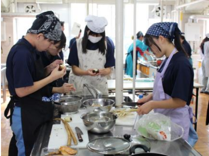
調理の様子(調理室・グラウンド)

11月8日(金)、収穫感謝の会を開催しました。加美農で収穫した米や野菜を食材に豚汁を調理し、おにぎりを作り、各クラスで競い合いました。開会行事で各部門の3年生から作柄報告があり、牧草ロール転がし・一輪車競争リレー・〇×クイズのレクリエーションを行い、おにぎり豚汁コンテストを実施しました。審査の結果、おにぎりの部の最優秀賞は1年1組、豚汁の部の最優秀賞は3年1組、総合の部の最優秀賞は3年3組となって、今年度の収穫に感謝する一日になりました。