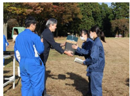
閉会行事での表彰