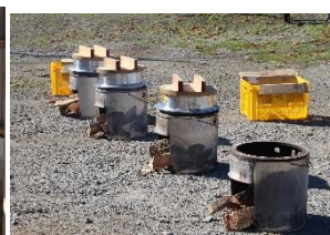
ご飯は釜で炊きました