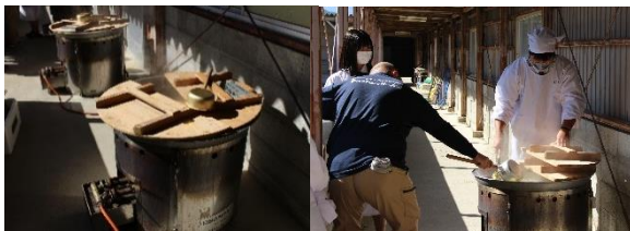
全員分の豚汁を作っています

10月31日（月）に収穫感謝の会を行いました。今年は各クラスの代表が調理室に集まって調理を行い、生徒・教職員みんなで収穫物に感謝しながら昼食をとりました。感染対策を行いながらの実施のため黙食や距離に気を遣いながらの会となりましたが、全員で同じものを食べることの喜びを再確認した行事となりました。午後には各部門から収穫状況等の報告会を行いました。また、「令和4年度高校生地産地消お弁当コンテスト」に出場し「みやぎ umami 感じる香し弁当」で優秀賞とWeb 特別賞をいただいた生活技術科チームが受賞報告を行いました。応援いただきありがとうございます。お弁当は来年2月頃にイオン各店舗やミニストップ各店舗で販売される予定です。よろしくお祈りします。