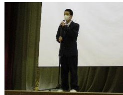
開会式で挨拶をする

11月16日（水）今年度の学習成果発表会を本校体育館で行いました。12月に行われる県のプロジェクト発表会の校内予選も兼ねています。10の専攻チームが今までの学習の成果を発表し、「最新技術で見る世界～コロナ禍での遠隔実習～」と題して発表した農業科草花専攻班が最優秀賞となりました。