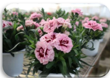
5月10日は母の日でしたが、本校のカーネーションもきれいに花を咲かせました。

生徒たちが学校に来られない間も作物や動物たちは育っていきます。この時期に行うべき作業がありますが、生徒たちができない分は農業科の教職員中心にその他の教職員も総出で行っています。