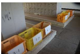
昇降口の課題提出箱

臨時休校期間中の前半はメールで課題を提示するのみでしたが、4月後半からは課題を郵送して取り組ませました。取り組んだ課題は生徒自身が提出することとしましたが、学校に持参する生徒が接触を避けながら提出できるよう昇降口に提出箱を用意しました。持参しない生徒は郵送で提出しました。