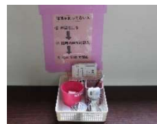
検温を済ませた生徒のみ 教室へ入ります

本校では5月25日(月)・5月29日(金)にも登校日を設けています。課題や問題点を改善しながら6月1日(月)からの本格的な再開に備えていきたいと考えています。