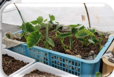
生物工学実験センターの わさびの苗と里芋の苗