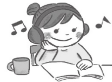
好きなことをして のんびり過ごす