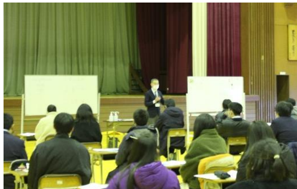
キャリアガイダンス全体会