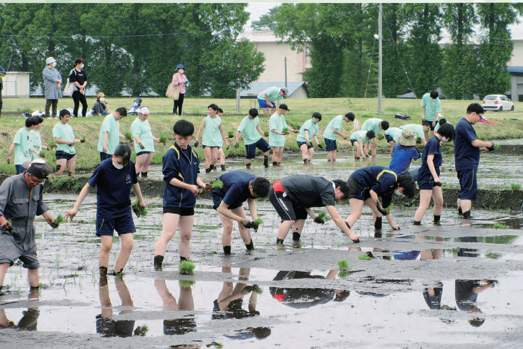
令和7年度入学生教育課程表(予定)

水稻・野菜・果樹・草花の栽培や家畜の飼育、植物バイオの学習が柱です。各専攻班におけるプロジェクト学習を通して実社会で役立つ課題解決の手法について学びます。3年生での「農業経営」では、模擬会社の経営を通して起業家精神を養います。