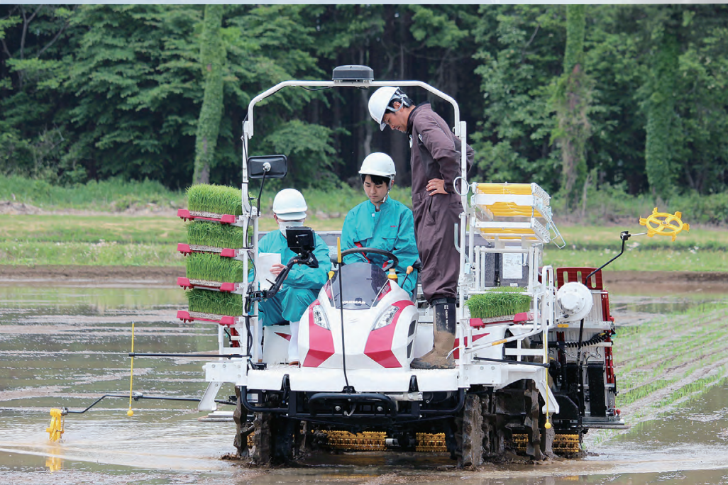
令和7年度入学生教育課程表(予定)

農業機械・工業用加工機械や自動車関連産業に関わる仕事に就くためのスペシャリストをめざし、知識と技術を学びます。また、農業機械に関する資格取得にも力を入れています。