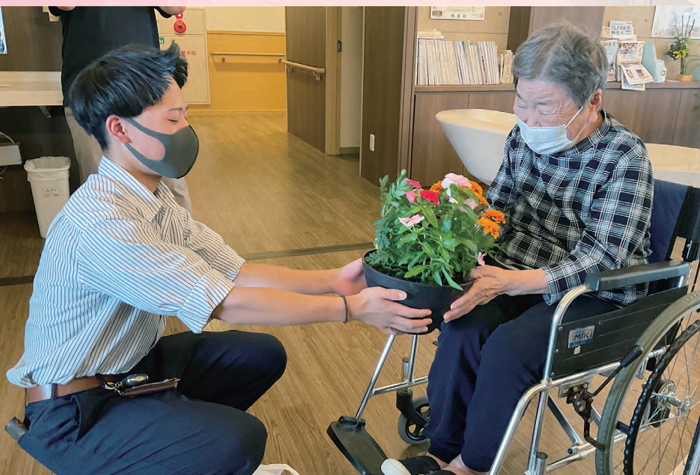
令和7年度入学生教育課程表(予定)

衣食住、ヒューマンサービスなど生活産業のスペシャリストを目指して、知識と技術を学びます。2年次から3つの専攻（野菜・果樹・草花）に分かれ、実習を通して郷土の食文化や6次産業への展開について学びます。