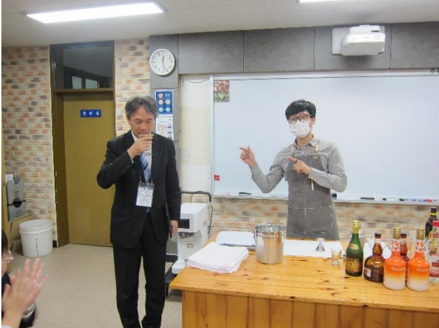
バリスタの先生がつくったドリンクを試飲しました。