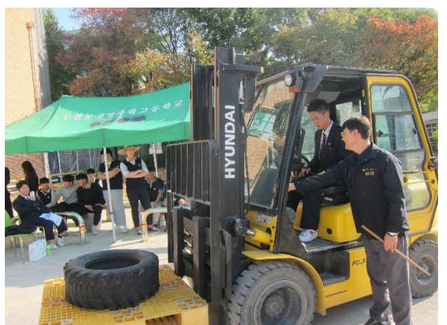
少し緊張しながらも、ショベルカーやフォークリフトの運転に挑戦しました。