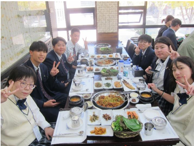
昼食後、水原の校名が入ったタンブラーや、伝統的なデザインのパーチなどをおみやげにいただきました。