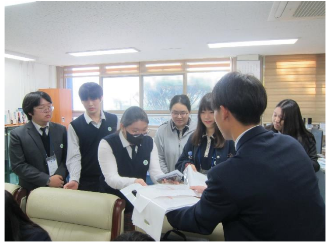
生徒たちにおみやげ（手ぬぐい）を贈呈しました。