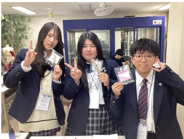
ドライフラワーやパンコールなどにレジンを流し込み、オリジナルのアクセサリーをつくりました。