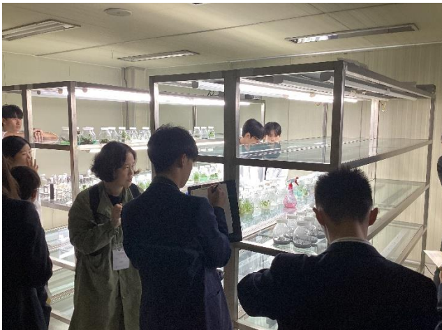
バナナやムクゲなど様々な植物を培養していました。