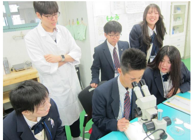
サツマイモの生長点培養に挑戦しました。