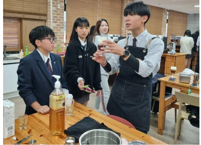
エスプレッソを使ってドリンクをつくりました。