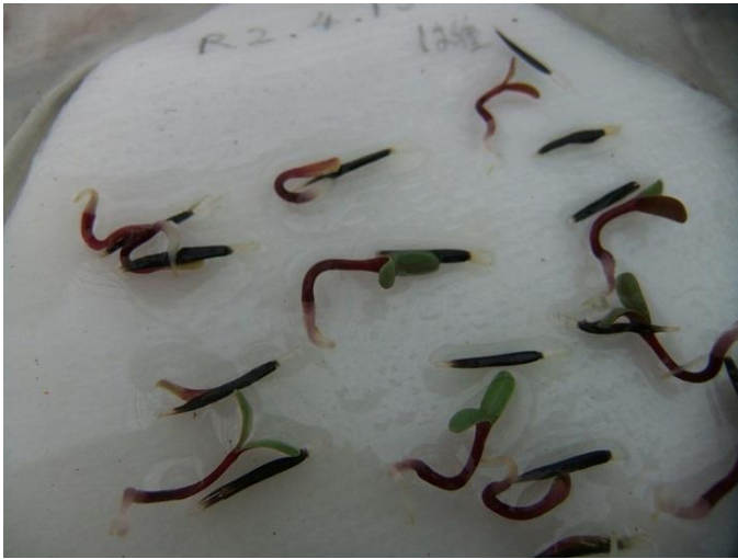
発根と発芽の様子