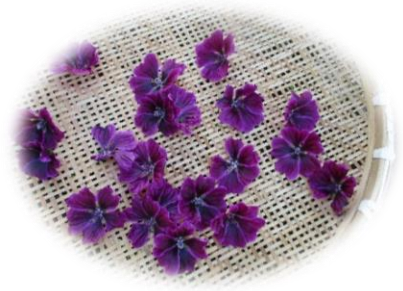
マロウのお花を摘んでハーブティー作り！