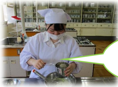
強力粉をふるいにかけている途中。